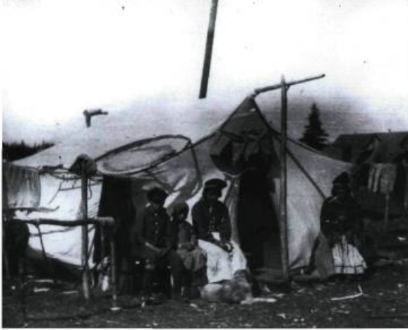
Captée vers 1920, cette photographie témoigne de la vie traditionnelle des Innus de Mingan en Moyenne-Côte-Nord.

MP-0000.361.11