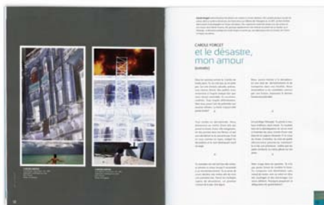
CAROLE FORGET « et le désastre, mon amour » (extraits) Art Le Sabord | numéro 93