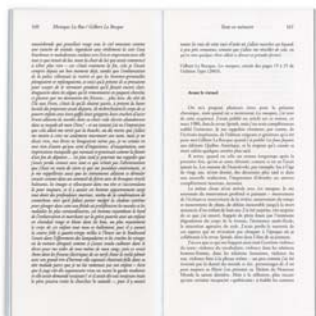
MONIQUE LA RUE « Avant le virtuel » Mæbius | numéro 132