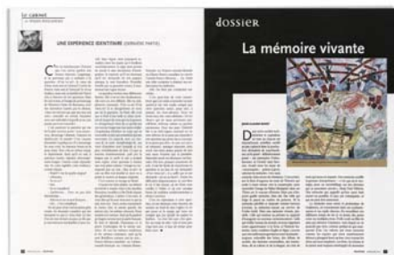
LES COLLABORATEURS Dossier « La mémoire vivante » Relations | numéro 758