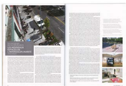
EDITH BRUNETTE « Les murs ne sont pas tous faits de pierres. Les nouveaux espaces de l'interdisciplinarité » Inter | numéro 111