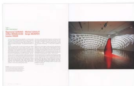
CLAUDE GUÉRIN Espace | numéro 100