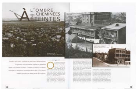
LES COLLABORATEURS Dossier « Vie de quartiers » Continuité | numéro 134