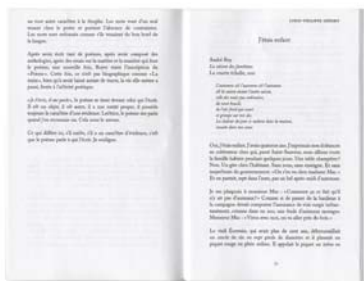
LOUIS-PHILIPPE HÉBERT « J'étais enfant » Estuaire | numéro 148