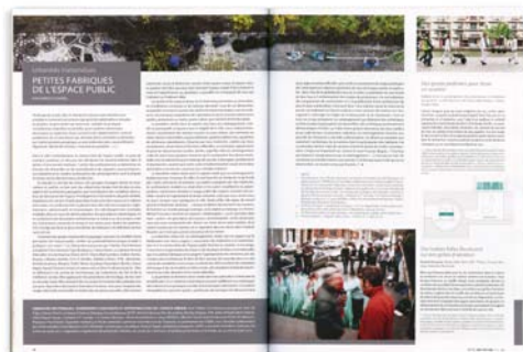
CHANTAL GAUDREULT Inter | numéro 111