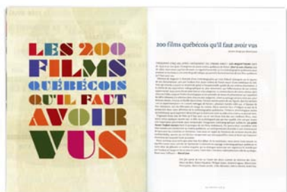
LES COLLABORATEURS Dossier « Les 200 films québécois qu'il faut avoir vus » 24 images | numéro 156