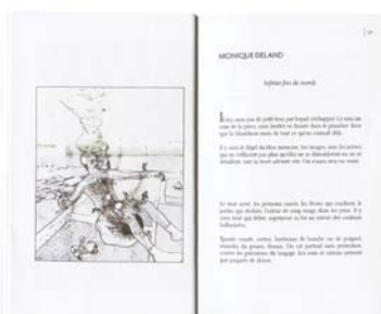
MONIQUE DELAND « Infinies fins du monde » Les écrits | numéro 135