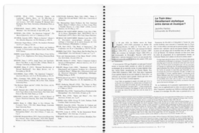
JACINTHE HARBEC « Le Train bleu : Déraillement stylistique entre danse et musique? » Les Cahiers de la SQRM | volume 13 | numéro 1-2