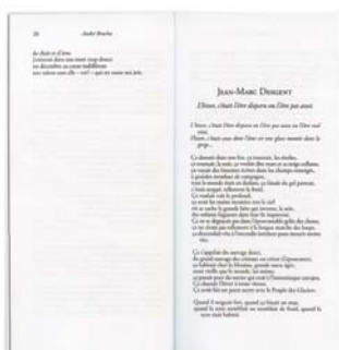
JEAN-MARC DESGENT « L'hiver, c'était l'être disparu ou l'être pas assez » Mæbius | numéro 132