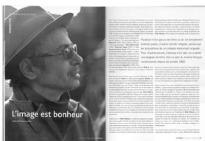
JEAN-FRANÇOIS HAMEL « Le cinéma de Léos Carax – L'image est bonheur » Ciné-Bulles | volume 30 | numéro 4