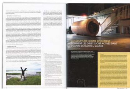
VICTORIA STANTON « La sculpture comme événement. Comment les objets sont activés dans l'œuvre de Mathieu Valade » Inter | numéro 110